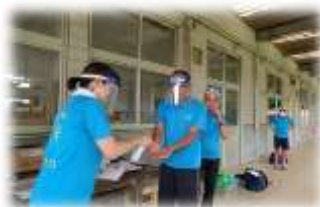
●感染症対策の様子