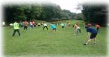
●再開した陸上競技プログラム