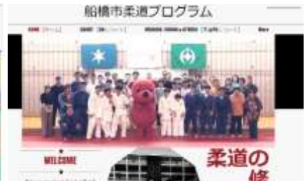
船橋市柔道プログラム