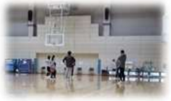
●再開に向けた打ち合わせ中…