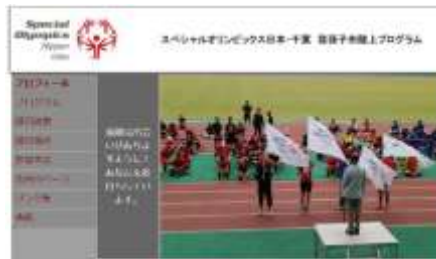
我孫子市陸上プログラム

今回ホームページを立ち上げたのは、「我孫子市陸上プログラム」と「船橋市柔道プログラム」の2つです。より細かにプログラムの情報を発信する予定です。SON・千葉のHPとともに、今後ともよろしくお願い致します♪