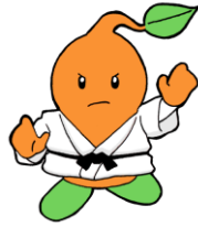
ピーナッツ君も柔道 Ver!