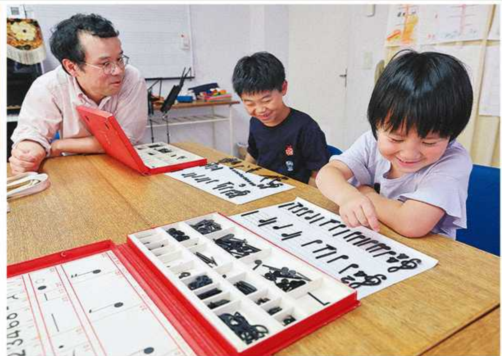
五線譜に音符や和音の模型を置いて、楽譜を学ぶ子どもたち

豊島区目白の閑静な住宅街に、日本を代表する建築家が設計した音楽教室がある。建築家は文化功労者にもなった吉村順三氏(1908~97年)、教室は氏の妻が開校した「ソルフェージュスクール」。ここで海外仕込みの珍しい指導法を半世紀以上、伝えてきた。ホールを備え、文化財登録の申請も検討中という教室をのぞいた。