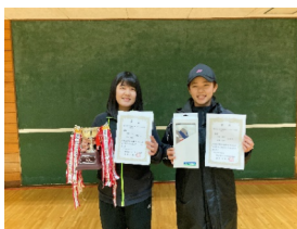
須藤・須藤(飯能市)