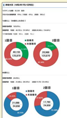
◀ワクチンメーター (戸田市ホームページ)