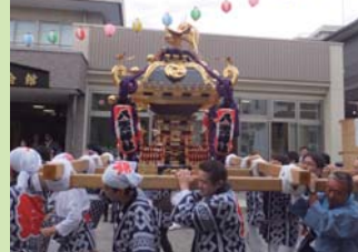
御神輿が駅ロータリーで結集！