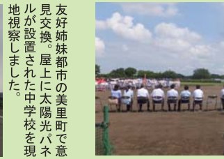
戸田市内の少年野球チームの閉会式。灼熱のグラウンドで白球を元気に追いかけていました。