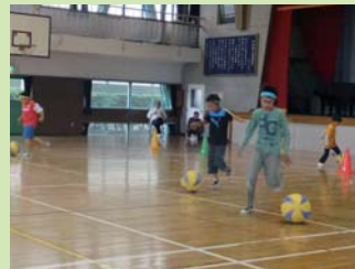
世代間交流を目的として28年続いている戸田市内の大運動会に参加しました。