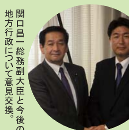
関口昌一総務副大臣と今後の地方行政について意見交換。