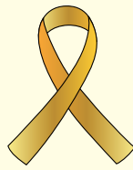
小児がん支援のゴールドリボン

小児がんの治療では、髪の毛が抜けたり気をつけていても太りやすくなるなどの影響があります。身近に小児がん経験者がいるお子さんには、見た目の変化は数カ月で戻ることや、薬の副作用があるのでからかったりしないことなどを話してあげましょう。