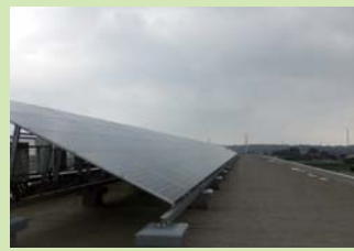
友好姉妹都市の美里町で意見交換。屋上に太陽光パネルが設置された中学校を現地視察しました。