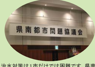
治水対策は1市だけでは困難です。県南7市治水大会で問題を共有し協議しました。