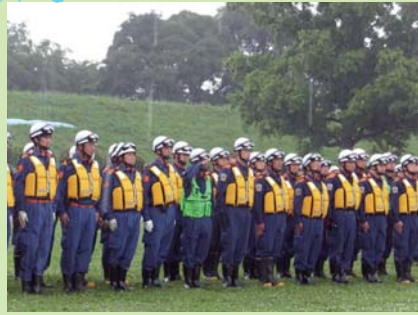
彩湖道満グリーンパークで戸田・川口・蕨、3市で組織される平成26年度荒川左岸水害予防組合水防演習に参加しました。防災ヘリポートが周辺状況を地上へ伝達するところから始まり、3市の意思の疎通がしっかりとて迅速な行動ができていました。