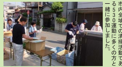
市内全域での清掃活動である530運動に多くの方が一緒に参加しました。