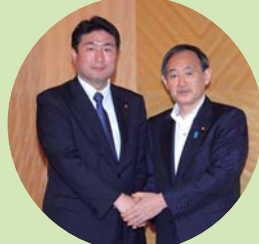
菅義偉内閣官房長官と一緒に。