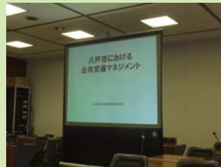
新幹線の停車駅八戸駅から中心市街地への公共交通機関のあり方について視察しました。